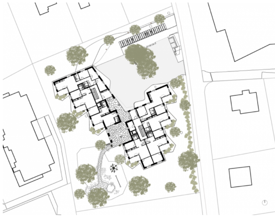
Situation mit Erdgeschoss