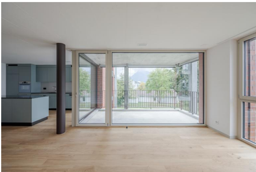
Ausblick zum Niesen.

In Nachbarschaft der Johanneskirche zu bauen, führte dazu, dass wir schon im Wettbewerb eine zeitlose und vor allem werthaltige Fassade vorgeschlagen haben. Ein Gebäude in Sichtmauerwerk scheint uns der richtige Ausdruck im Kontext der durchgrünter Gärten des Quartiers und der Betonkirche zu sein.