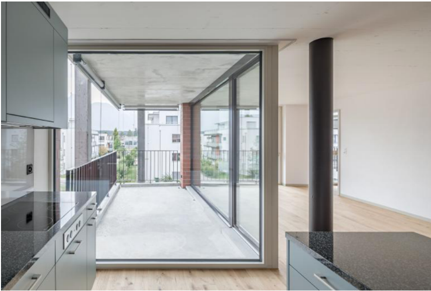
Blick in die Loggia.